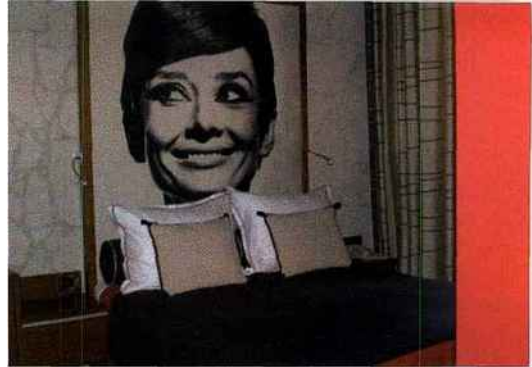
Les chambres du Riva sont un hommage au cinéma

Les hôtels du « Tito Time » de l'époque de Tito appartiennent désormais au passé. Boutiques hôtels, spa, resorts... relookés design, ils ont fait place à des établissements de luxe pour la jet-set internationale et familiale. Sur le quai, face à une rangée de palmiers, le Riva, à la fois rock and roll et glamour, fait son cinéma. Tonalité de rouge profond, les photos des stars, d'Audrey Hepburn à Brigitte Bardot, s'affichent sur les murs dans un long travelling. Des couloirs aux chambres en passant par le bar, le Riva fait l'apologie du corps et de la sensualité, et l'on s'endort dans l'ambiance fun beautiful people des années sixties. Au bord de l'eau, la longue terrasse avec ses canapés profonds, est une invitation à la contemplation. En prenant un verre