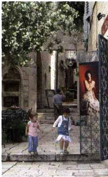
C'est à l'ombre des ruelles que l'on découvre les galeries et tavernes pleines de charme