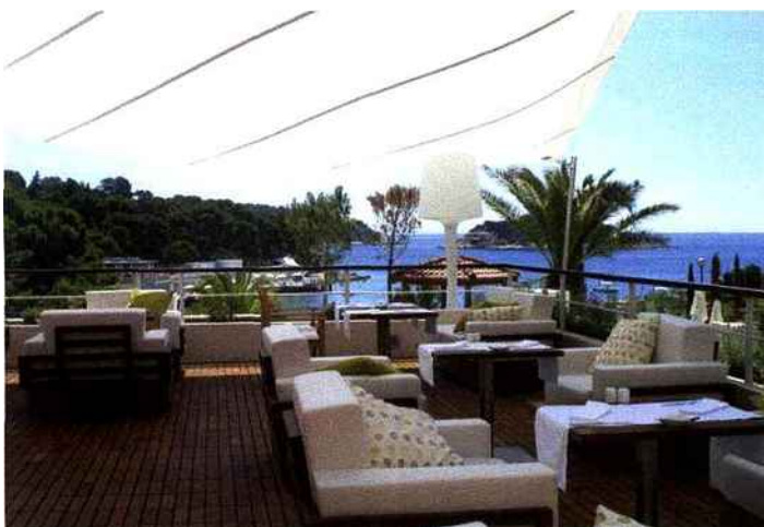
Une pause déjeuner élégante et paisible au bord de l'eau au restaurant de L'Amfora