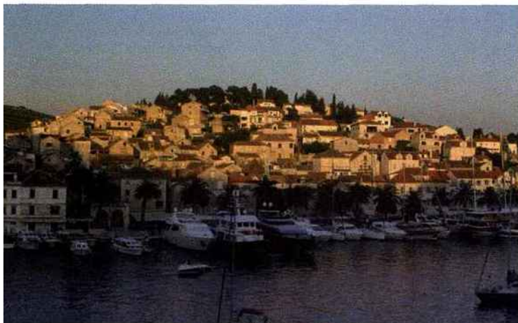
Au coucher du soleil, la petite cité et le port de Hvar se couronnent d'or