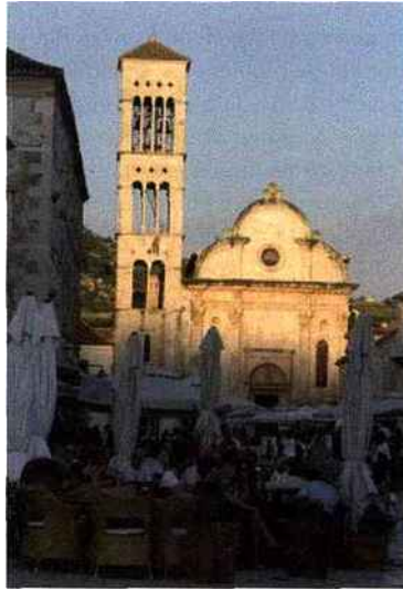
Sur la place très vénitienne, prendre un verre à une terrasse est un rituel obligatoire et mondan

Très « bain de mer », l'Amfora est le tout dernier resort en date et aussi le premier du genre à se consacrer au balnéaire et au tourisme d'affaires. L'un et l'autre peuvent aller de pair ! Dans l'abri d'une vaste crique, le vaste bâtiment blanc émerge de la pinède. Un palais de cristal tout de blanc et de verre aux chambres lumineuses et décor zen contemporain. Baies vitrées prolongées par des balcons, salle à manger, salons... Partout, on privilégie l'espace et la lumière et la vue. Spectaculaire, le jardin qui descend vers la mer avec une dégringolade de cascades, de piscines qui rejoignent la plage, un concept encore unique dans l'Adriatique. Juste à côté, dans le style très « Bathing beauty » le beach club, Bonj « les bains », est l'endroit chic et exclusif, la parenthèse très privée pour passer une journée de rêve. Au bord de l'eau, d'une transparence éblouissante, des rangées de cabines de bains, de longs pontons en teck où l'on a disposé les chaises longues sous les parasols, semblent attendre Jena Rolland sortant de l'onde en compagnie de Johnny Wessmuller. À l'ombre des pins, on peut pratiquer une séance de relaxation ou de thai chi, déjeuner au grill d'une dorade ou d'une salade de poulpes et dans l'intimité d'une tente se réserver un massage et puis plonger dans la mer, elle est à vos pieds. Des vacances de star.